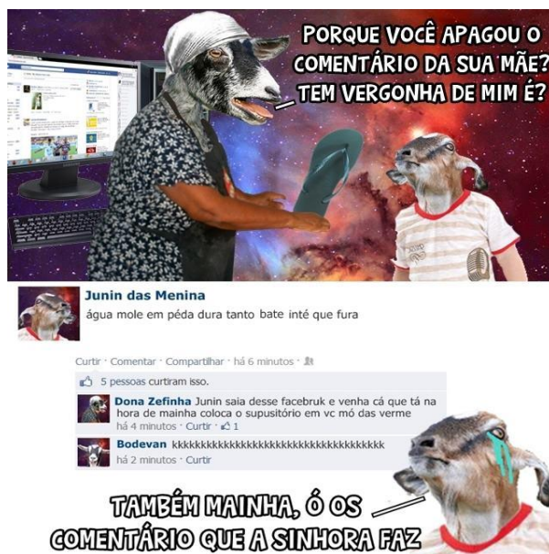
Figura 3: Publicação mais comentada – 15.570 Comentários