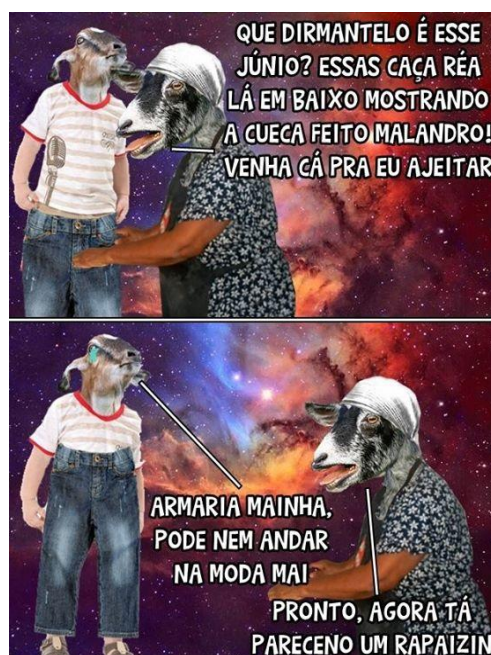
Figura 2: Publicação mais curtida – 88.612 “Curtidas”