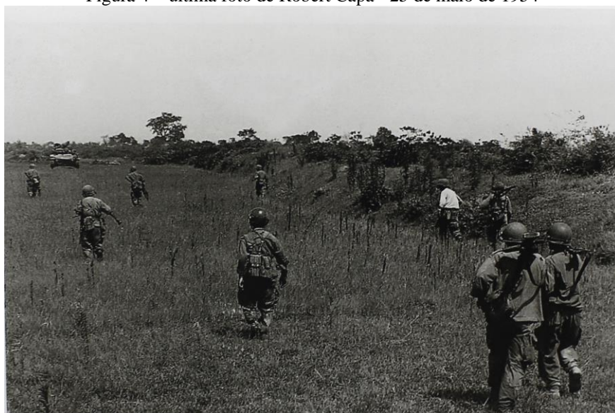
Figura 4 – última foto de Robert Capa - 25 de maio de 1954