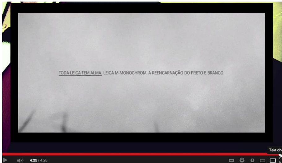
Figura 7 – frame final do filme