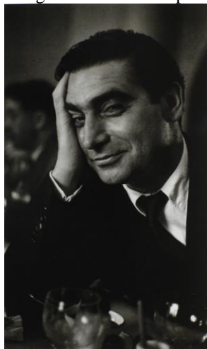
Figura 3 - Robert Capa