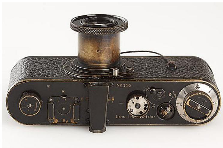
Figura 1 - Leica 0-Series

No ano de 1923 produziram 31 exemplares deste novo modelo, distribuídos a fotógrafos profissionais para que o testassem. Paradoxalmente, as críticas foram desfavoráveis, pois achavam o formato muito pequeno. Mesmo assim a produção continuou e na Feira de Leipzig de 1925 foi apresentada ao público a primeira Leica, abreviatura de Leitz Camera, um nome que haveria de perdurar e brilhar no mundo da fotografia. Os anos se passaram e hoje “o ser humano [...] não sabe mais olhar, a não ser através do aparelho. (FLUSSER, 1985, p.30).