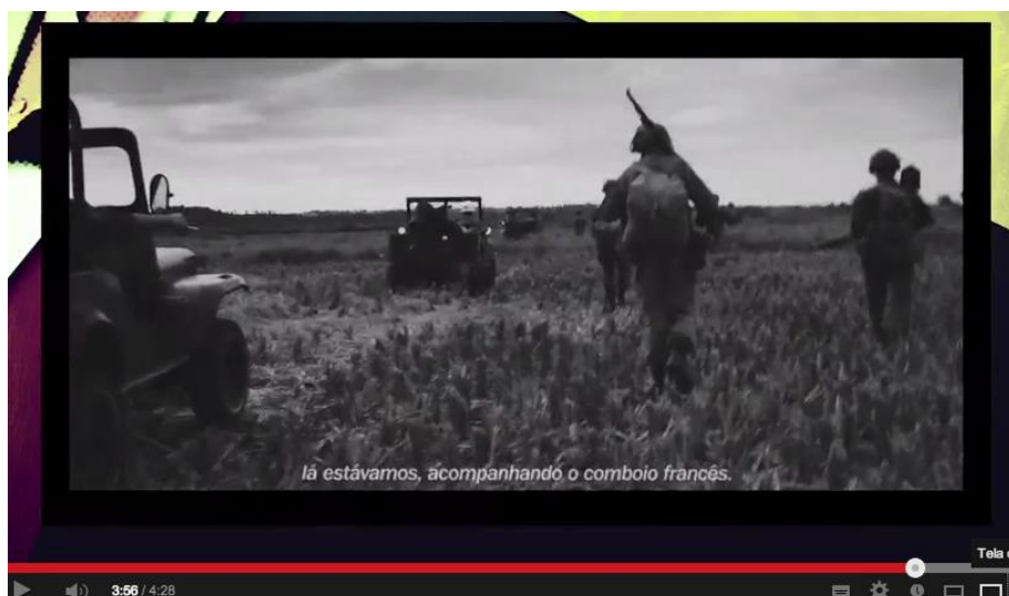
Recriação de cena baseada na última foto de Robert Capa