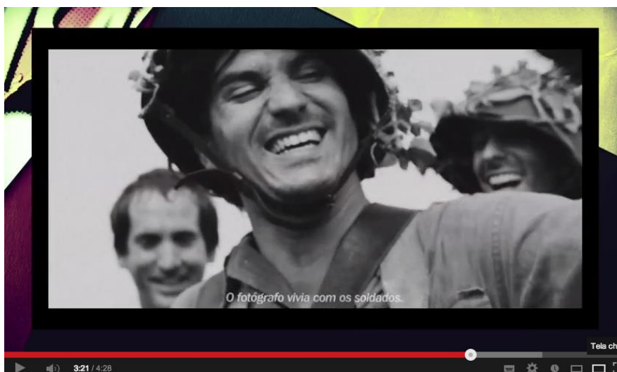
Figura 6 – frame 3'21''